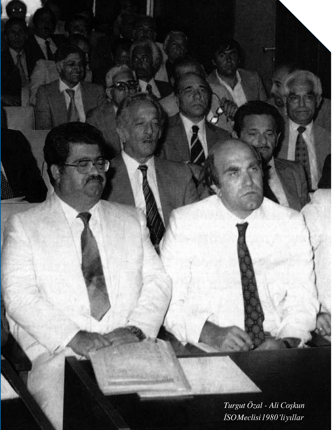
Turgut Özal - Ali Coşkun İSO Meclisi 1980'li yıllar